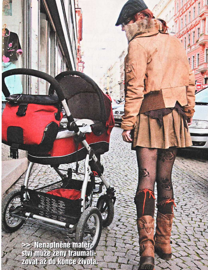
>> Nenaplněné mateřství může ženy traumatizovat až do konce života.